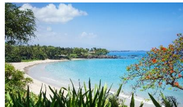
（左：プリンス ワイキキ、右上：ウェスティン ハプナビーチリゾート、右下：マウナケアビーチ ホテル）

『トラベル・アンド・レジャー（Travel + Leisure）』は、『コンデナスト・トラベラー（Conde Nast Traveler）』や『ナショナル・ジオグラフィック・トラベラー（National Geographic Traveler）』と並ぶ、グローバル展開をする大手旅行雑誌の一つです。毎年、読者投票を基に発表する「ワールド・ベスト・アワード」は、26年間の歴史を誇る企画です。毎年世界中の注目を集めるランキングで、世界の観光都市、ホテル、リゾート、クルーズ船、航空会社など多岐にわたるカテゴリーがあります。